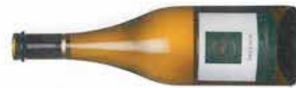
Domaine Henri Cruchon, Echichens Sauvignon S 2013 16.5 Points | 2014 à 2018

Ce vin structuré possède une belle vinosité et une matière qui sait être charmante sans devenir charmeuse. On aime la robe soutenue, le nez mûr où une pointe de miel se mêle à des notes minérales et des arômes de mangue ainsi que la vivacité qui rafraîchit la bouche ample et fruitée.